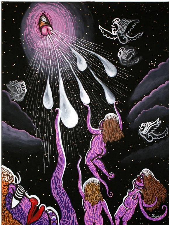
Plaisir vaginal – 80 cm x 60 cm – 2015

Jeune encore, l'art de Gary Indy évolue rapidement, se complexifiant au cours du temps. Ses Vénus qui, auparavant, ne présentaient aucune trace d'humanité et n'avaient de féminin que les références crues à leurs attributs reproductifs et leurs attitudes lascives, se sont humanisées et transformées en véritables personnages sensibles animés d'expressions faciales souvent exagérées. Tirant vers la caricature amusée d'une animalité primaire, l'obscène et le pornographique alors s'effacent derrière une candeur désarmante mâtinée de malice ludique, presque enfantine, désinhibant le contemplateur et désamorçant tout procès de moralité.