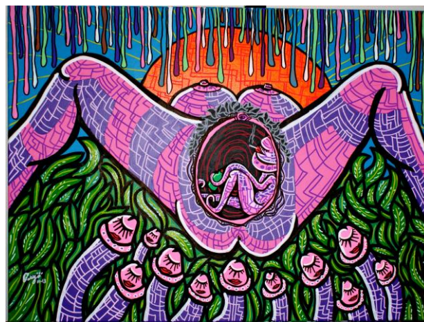
La nouvelle génération – 100x60 – 2013

contrastant avec les mises en scène la plupart du temps choquantes, participent de cette déconstruction innocente du corps reproducteur, des tabous sexuels et des rapports défendus. La catharsis ainsi distillée se nourrit à la fois d'une remontée, jusqu'au néolithique, aux origines de l'art et de l'humanité, et de la descente dans les tréfonds des pulsions charnelles et de la violence de leurs expressions.